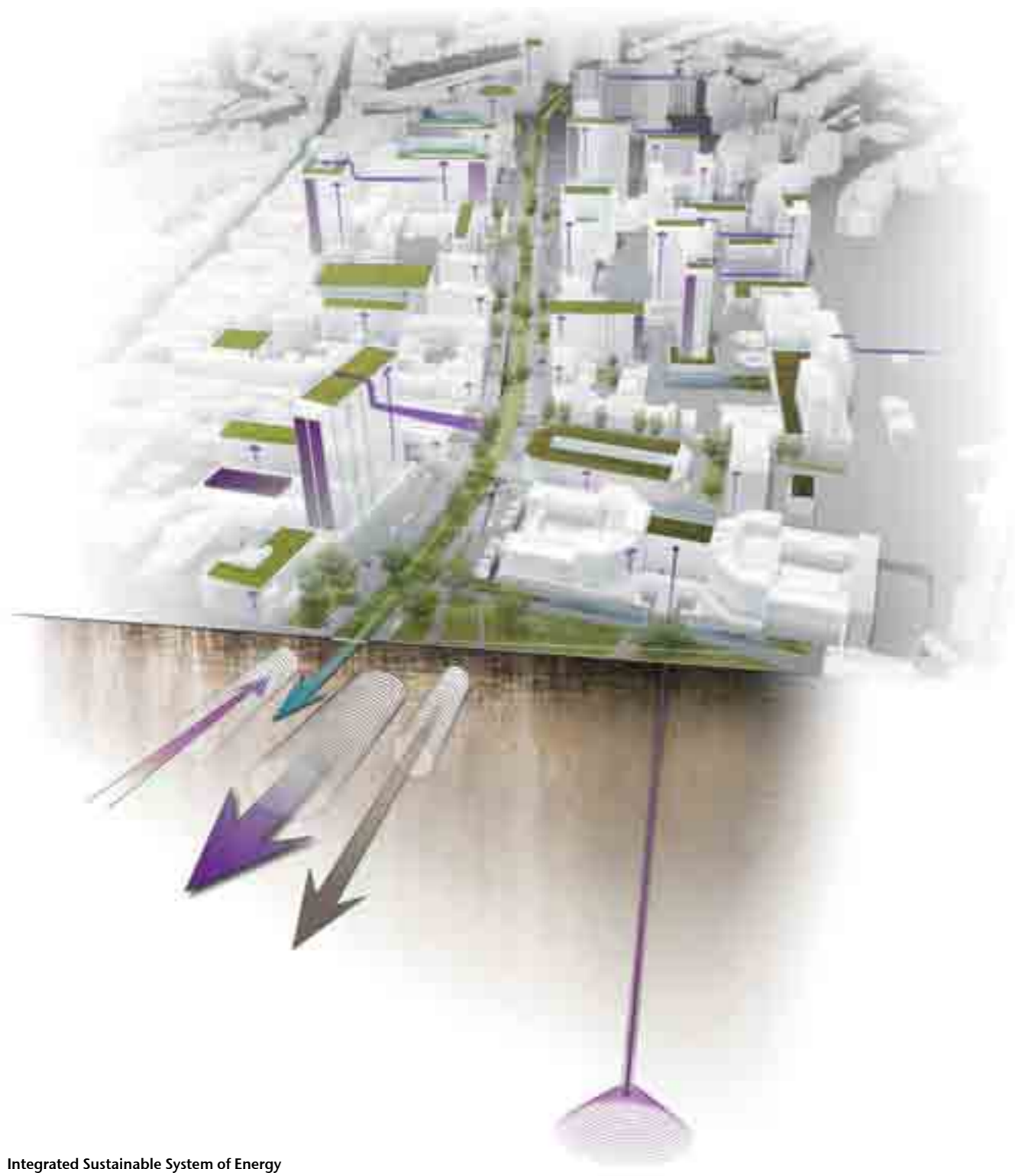
Integrated Sustainable System of Energy